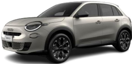
Sabbia – Earth of Italy