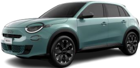
Azzurro – Sky of Italy