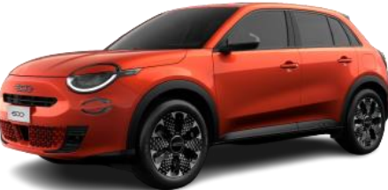
Arancio - Sun of Italy