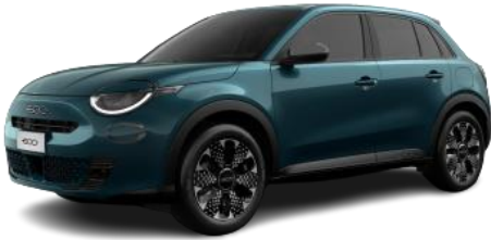
Verde – Sea of Italy