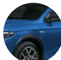
Blu Italia 5CC - 018