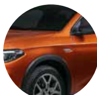
Arancia Paprika 6FX - 417