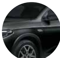
Nero Cinema 5CD - 718