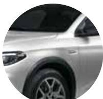
Bianco Gelato 5CA - 249