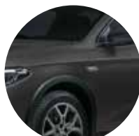
Grigio Moda 5DR - 695