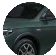
Verde Foresta 1WX - 468