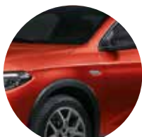
Rosso Passione 6Y3 - 168