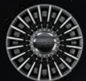
16" lichtmetalen velgen