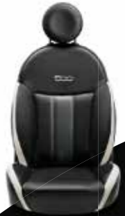
Zwarte sportstoel deels uitgevoerd in eco-leder met witte accenten.