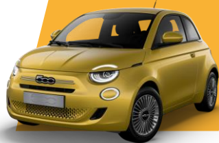
SUN OF ITALY (metallic)