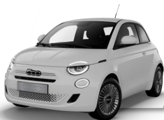
ICE WHITE (effen lak)