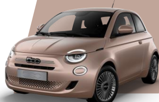
ROSE GOLD (metallic)