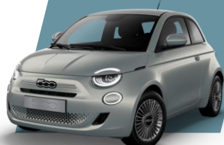
CELESTIAL BLUE (metallic)