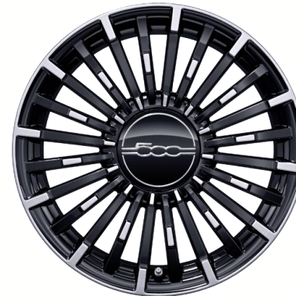
17" lichtmetalen velgen Diamond Cut