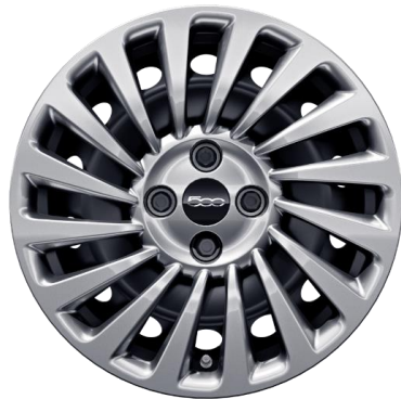
15" stalen velgen met sierdeksel