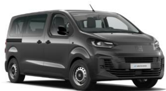
DONKERGRIJS METALLIC (COLOSSEO) AY6 550,00€ (665,00€)