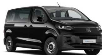
ZWART METALLIC (CINEMA) 5DP 550,00€ (665,00€)