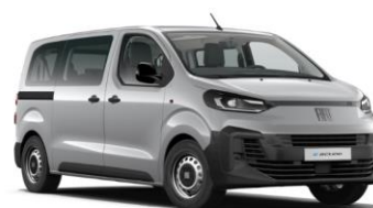
LICHTGRIJS METALLIC (MAESTRO) 5DN 550,00€ (665,00€)