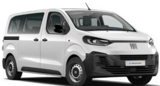
WIT (ICY WHITE) 5DL 0,00€ (0,00€)